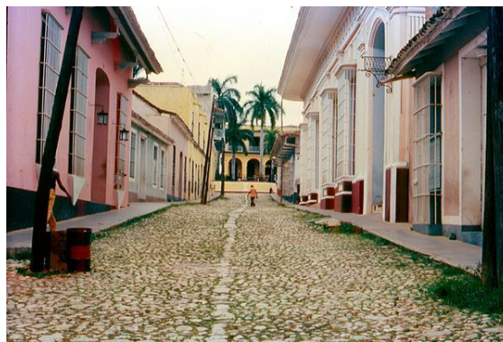
Trinidad, dal 1988 Patrimonio dell'umanità.