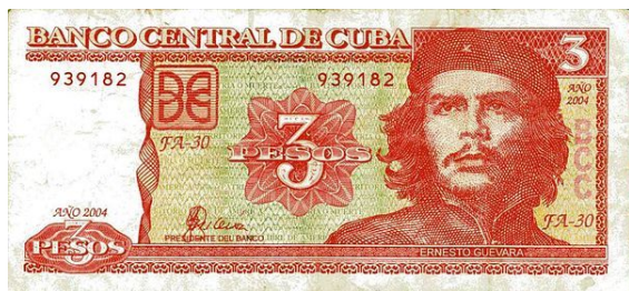
Banconota cubana da 3 pesos (fronte) con l'effigie di Ernesto Guevara detto El Che.

Cuba in seguito alla rivoluzione ha adottato un'economia pianificata di stampo socialista e quasi la totalità dei mezzi di produzione appartengono allo Stato cubano. Secondo i dati della CIA del 2012 Cuba ha un PIL nominale di 72,3 miliardi $ (68ª nazione al mondo, davanti anche a numerose nazioni europee). I castristi affermano inoltre che questa cifra è stata stimata al ribasso, essendo rilevata da un'organizzazione notoriamente anticomunista: a supporto della loro tesi citano i dati per indice di sviluppo umano, dove Cuba è al 50º posto. Si veda, per la lista completa, Lista di stati per PIL (nominale).