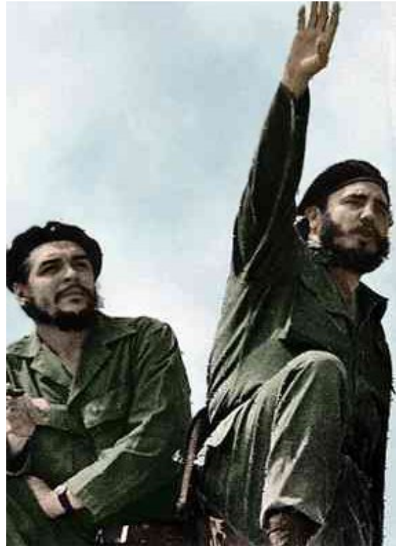
Che Guevara e Fidel Castro nel 1961, fotografati da Alberto Korda.

Dopo un tentativo di insurrezione fallito e un periodo di reclusione, l'avvocato Fidel Castro riorganizzò dal Messico la lotta contro la dittatura insieme ad alcuni volontari, tra cui il medico argentino Ernesto Guevara , detto 'Che', e l'italiano Gino Donè Paro , detto 'el Italiano'. La rivoluzione cominciò con la spedizione di 82 persone che, sbarcate sull'isola, affrontarono l'esercito e ripiegarono sui monti della Sierra Maestra per un periodo iniziale di lotta durante il quale cercarono e ottennero il consenso tra la popolazione. Questo permise la costituzione di un piccolo esercito popolare che affrontò quello nazionale attraversando tutta l'isola, fino alla decisiva battaglia di Santa Clara, il 30 dicembre del 1958. La notte di capodanno del 1959 Fulgencio Batista si dette alla fuga trafugando denaro delle riserve nazionali; il 1° gennaio 1959 le