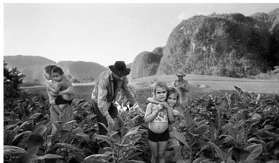
Manuel Rivera-Ortiz: Tabacco raccolto, Valle de Viñales, Cuba 2002

Il sistema è entrato in crisi negli anni ottanta in seguito alla caduta dei prezzi dello zucchero sui mercati internazionali. Senza rinnegare il suo carattere socialista, nei primi anni novanta il governo ha avviato una parziale transizione di mercato (legalizzazione delle libere professioni, dei mercati agricoli in cui i contadini vendono al libero mercato i loro prodotti, apertura verso investimenti stranieri) e dal 1993 ha legalizzato il dollaro statunitense col quale per almeno un decennio turisti e cubani hanno acquistato nei negozi statali in moneta forte, sostituito, poi, nel 2004 dal cuc o peso convertibile, che vale 25 pesos cubani. Una caratteristica saliente dell'economia è il contrasto tra i settori relativamente efficienti del turismo e delle esportazioni, e i settori domestici inefficienti.