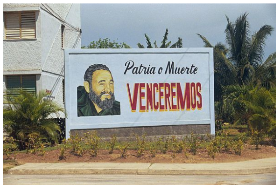
Un cartellone di propaganda: Patria o Morte. Vinceremo

surati e maggiorenni (l'età prevista per il raggiungimento della maggiore età a Cuba è 16 anni).