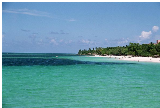
La spiaggia di Varadero

Il turismo a Cuba si sta sviluppando a passi da gigante, diventando una delle voci più importanti dell'economia