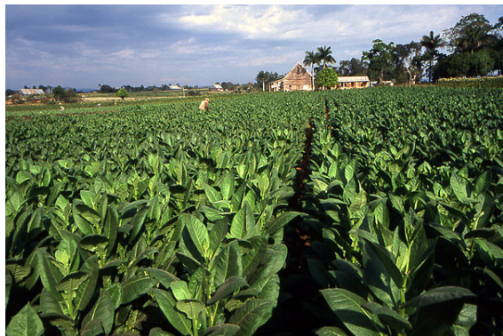
Piantazione di tabacco a Pinar del Río.

Durante gli anni sessanta il governo cubano dovette tutelare i boschi per via del precedente disboscamento. Il governo attuò in tutta l'isola dei programmi di rimboscimento che riportarono le foreste a ricoprire il 27,8% del territorio; il legname prodotto è prevalentemente quello dei pini.