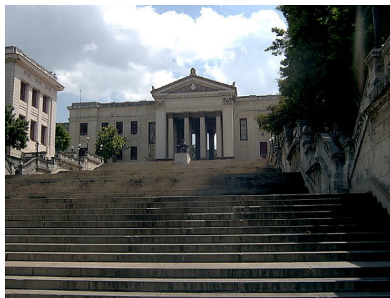
L'Università de L'Avana, fondata nel 1728.

Nel 1957, poco prima che Castro salisse al potere, il tasso di alfabetizzazione era quasi dell'80%, il quarto nella regione, secondo le Nazioni Unite, superiore a quello della Spagna [15] . Castro creò un sistema interamente statale e vietò le istituzioni private. Il 99,8% della popolazione adulta è attualmente alfabetizzata [16] . La scuola cubana è obbligatoria dai 6 ai 16 anni di età ed è completamente gratuita, inclusa l'università. Lo Stato fornisce gratuitamente agli studenti il materiale scolastico, il servizio mensa e anche l'alloggio per frequentare l'università. Durante gli anni sessanta il governo cubano si impegnò in una massiccia operazione di alfabetizzazione popolare: furono aperte nuove scuole e nuovi centri di studio soprattutto nelle aree rurali, furono introdotte biblioteche nelle zone rurali e le scuole private e parrocchiali vennero nazionalizzate.