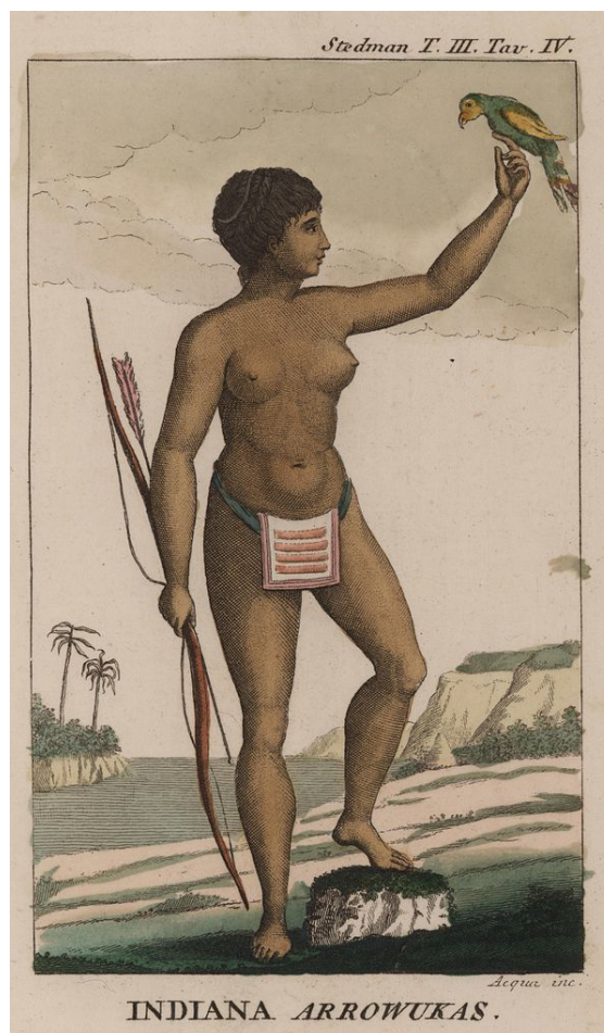
Rappresentazione di una donna Taino.

Gli Spagnoli, così come fecero nel resto delle colonie americane, soggiogarono i circa 100 000 indigeni dell'isola, che nell'arco di un secolo vennero quasi tutti sterminati in primo luogo dalle malattie di origine “europea” contro le quali i sistemi immunitari indigeni non erano preparati, e in secondo luogo dai lavori forzati in cui gli indigeni furono normalmente impiegati. In seguito gli occupanti introdussero nell'isola schiavi africani i quali arrivarono presto a essere una larga parte degli abitanti.