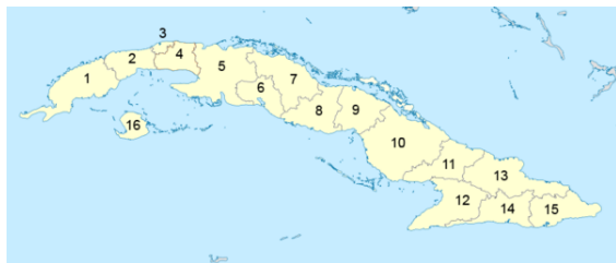
Regioni di Cuba

Cuba è divisa in 16 province composte da 169 municipalità e da una municipalità speciale (l'Isola della Gioventù, o Isla de la Juventud conosciuta fino al 1978 come Isla de Pinos ).